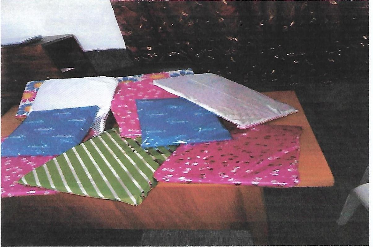
جوائز الطلبة المتفوقين

على إثر إختتام الجمعية لانسطيا التعليمية لهذه السنة، نظمت الهيئة المديرية للجمعية يوم الجمعة 05 جولية 2019 حفل تم خلاله تكريم الطلبة المتفوقين بجوائز تشجيعا لهم على حسن اجتهادهم و تحفيزا لهم على مواصلة التالف و التميز كما تم توزيع بعض الهدايا و المشروبات و الحلويات على الحضور الكريم.